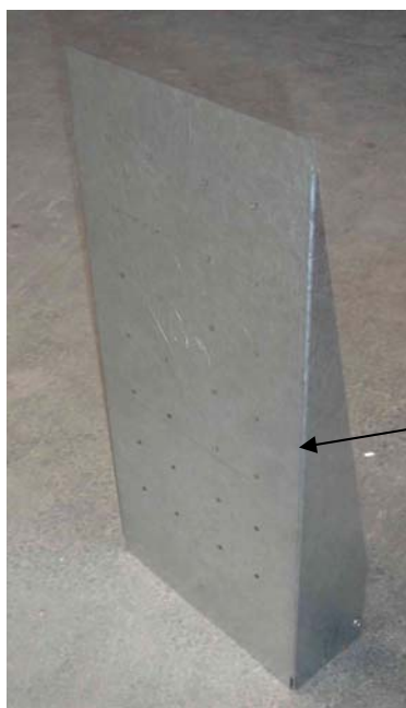
Montageplatte, 2mm verzinktem Blech