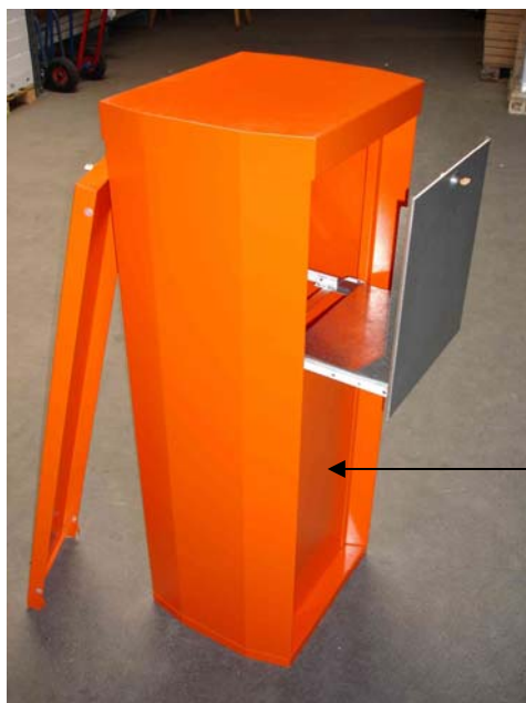
Vordere Abdeckplatte, mit zwei Flügel- muttern demontierbar

Die Säule kann auch von vorne unten geöffnet werden. Es müssen lediglich zwei Flügelmuttern entfernt werden, um die vordere Platte auszuhängen. Somit kann die Säule auch mit dem Rücken an eine Wand montiert werden.